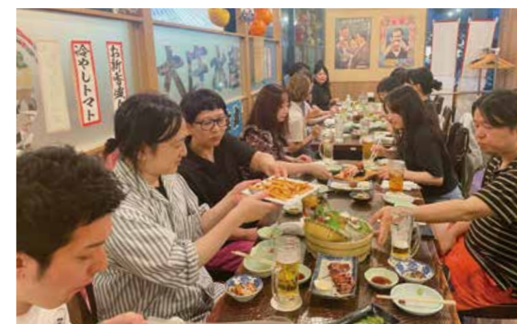
企画制作合同交流会